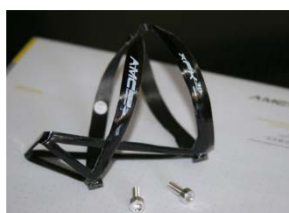
xFK in 3D-Ultraleichtbau