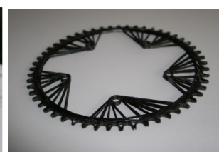
xFK in 3D-Kettenblatt