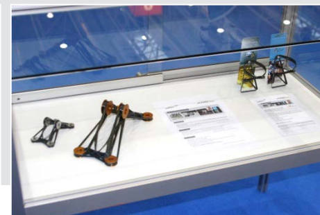
Bild links v. oben n. unten: Vitrine am AMC-Messestand mit xFK in 3D-Konsole, die als Markenbotschafter des LTF fungierte; Podiumsdiskussion mit Leichtbau-Experten; xFK in 3D-Exponate auf der PDA