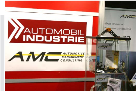
Bild unten: AMC-Technologieberater Peter Fassbaender auf dem Messestand von AMC und AUTOMOBIL INDUSTRIE